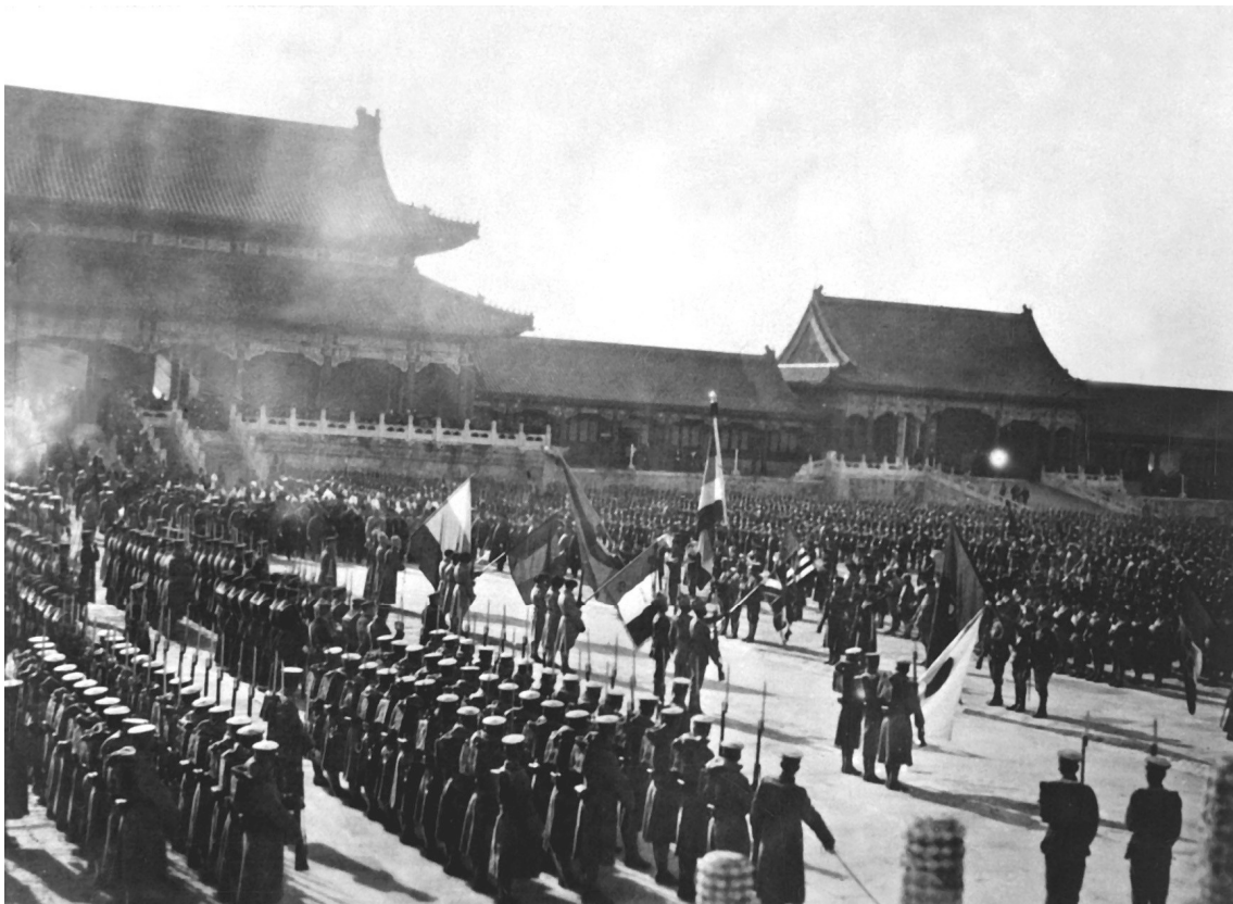
Foto gemaakt in 1901 in de Verboden Stad, het paleis van de Chinese keizer: